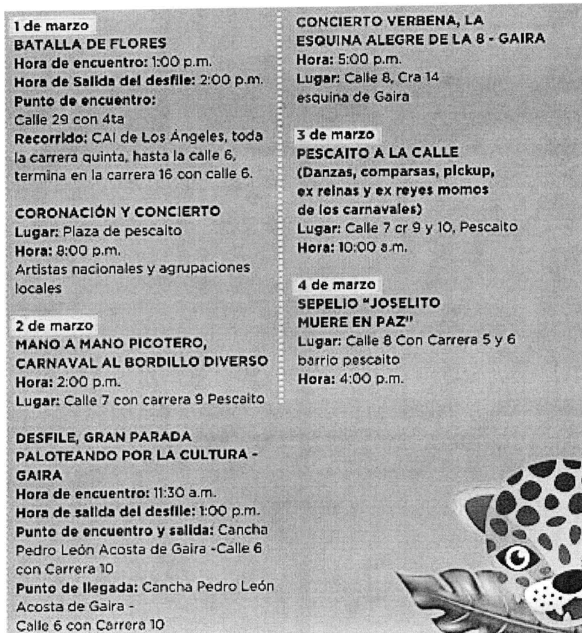
Imagen No. 3